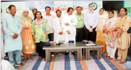
ٹائٹل اور ادبی فورم اور پاک برٹش آرٹس کے زیر اہتمام محفل مشاعرہ کے شرکاء کا گروپ فوٹو